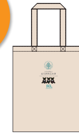
② オリジナルトートバッグ