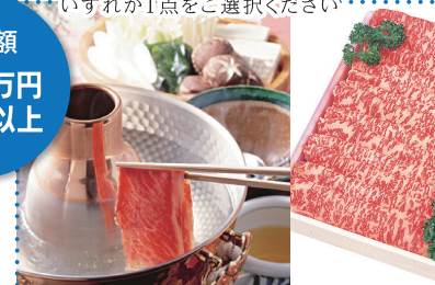
⑩ 小倉牛特選ロース しゃぶしゃぶ肉700g[野村肉舗]