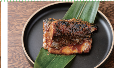
⑥ ぬか味噌焼きセット [宇佐美商店/旦過市場]