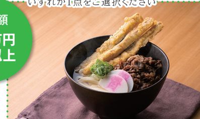
⑤ 肉ごぼ天うどん5人前[資さんうどん] ※写真はイメージです