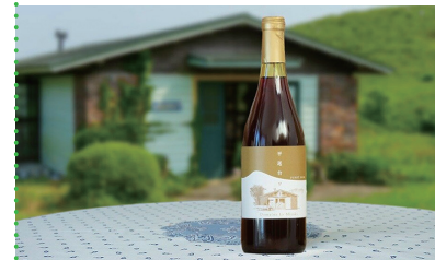
⑧ 平尾台ワイン「ピノ ノワール」 [ドメヌ・ル・ミヤキ]