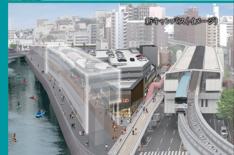
新キャンパス(イメージ)

新学部「情報イノベーション学部 (仮称・設置構想中)」が2027年4月 小倉都心部(旦過市場)に誕生!