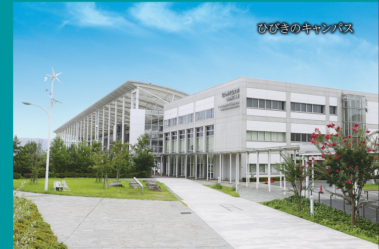
ひびきのキャンパス