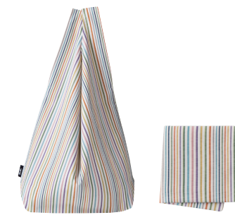
⑨ 小倉織シンプル バッグS&小風呂敷 (ハンカチ)セット (柄名:白多彩)[小倉 縞織]