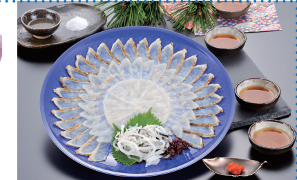
⑪ ふく太郎本部 食楽庵ふる川 ふく刺三種盛り [北九州観光コンベンション協会]

※返礼品は、追加・変更となる場合があります。北九州市立大学基金ホームページでご確認ください。